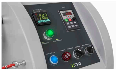
Pannello di controllo per impostare la velocità e la temperatura