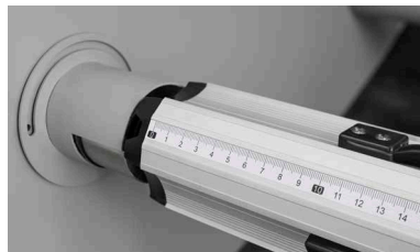
Scala millimetrata sugli alberi per il corretto posizionamento del materiale