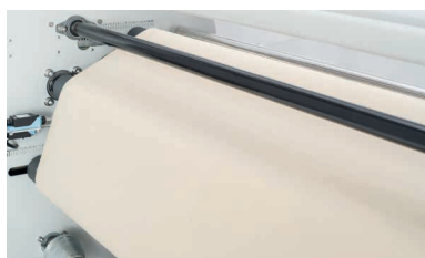
Tappeto in feltro di alta qualità