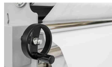
Regolazione tensionamento del tessuto