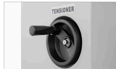
Regolazione della tensione del feltro